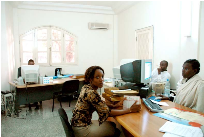
Oficina del APIX.

España no tiene acuerdo para evitar la doble imposición con Senegal.