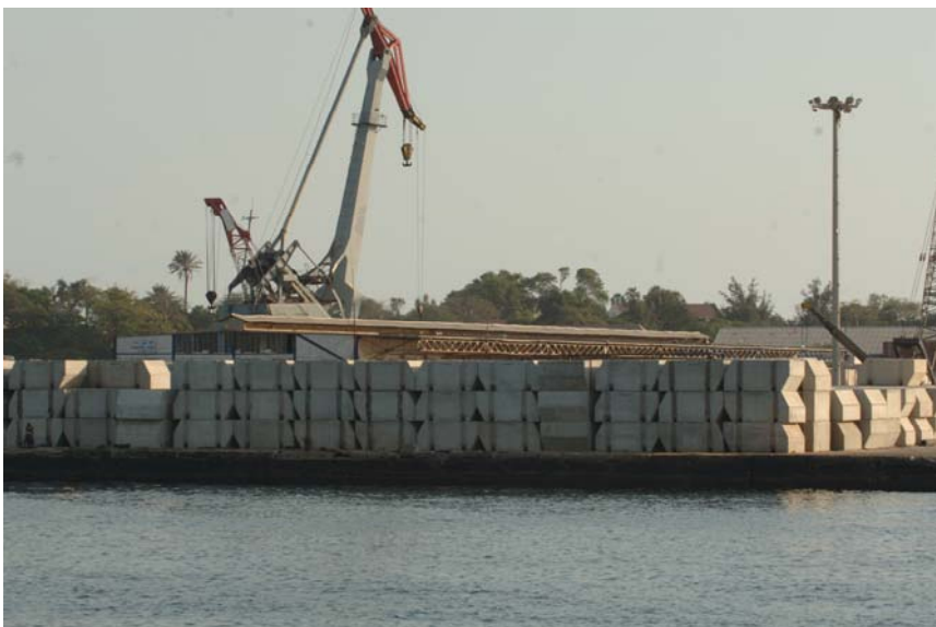
Puerto de Dakar.

Iberia, une Dakar con Madrid diariamente, y con escala en Las Palmas, dos días por semana. Air Europa tiene 2 frecuencias semanales entre Dakar y España. La mayoría de las compañías aéreas ofrecen servicio de carga aérea regular.