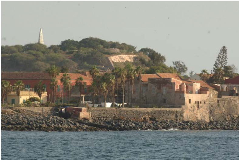
Miles de turistas visitan cada año la Isla de Goree.

El sector servicios es el más activo de la economía senegalesa y el que más contribuye al PIB, con una aportación superior al 60%. Las telecomunicaciones, el turismo, los transportes y los servicios financieros son algunas de las actividades más importantes.