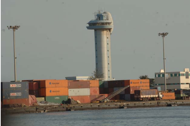
Puerto de Dakar.

Senegal tiene una red de carreteras de 14.600 km en buen estado, para los estándares de África occidental, con un 40% de ellas asfaltadas. Las 3 carreteras de mayor tráfico son las que unen Dakar con Kidira (frontera con Malí), Gambia y Casamance, en el Sur del país, y con la frontera mauritana, a lo largo del río Senegal. Están en marcha algunos proyectos de rehabilitación de la red.