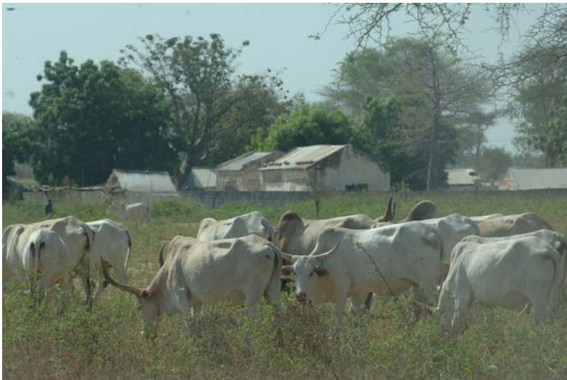
Modernizar las explotaciones ganaderas